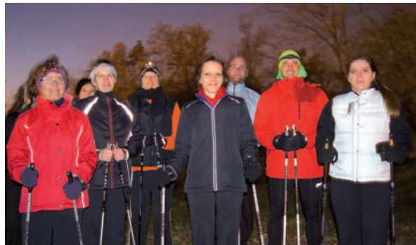
↑ Nordic Walking Gruppe, AOK