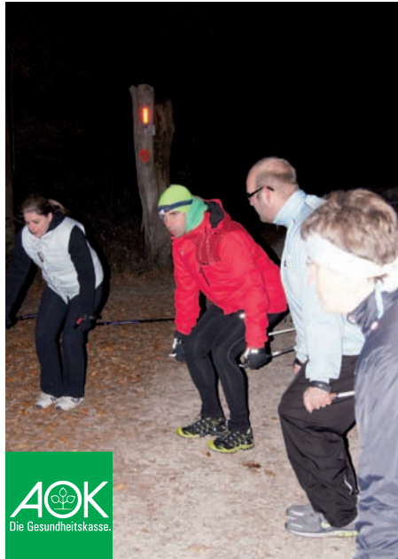
↑ Die Gruppe beim Aufwärmen

Nach einer Umfrage der Gesellschaft für Konsumforschung (GfK) ist Nordic Walking damit die beliebteste Sportart, mit der Bundesbürger neu beginnen.